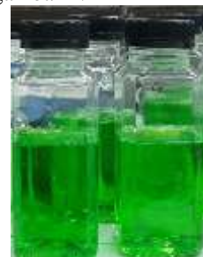
Gambar 1. Sabun cuci piring

Sabun cuci piring cair merupakan cairan kental bening yang pada umumnya berfungsi untuk membersihkan peralatan seperti gelas, piring, sendok/garpu, wajan, dan peralatan dapur lainnya. Gambar hasil sabun cuci piring dapat dilihat pada gambar 1.